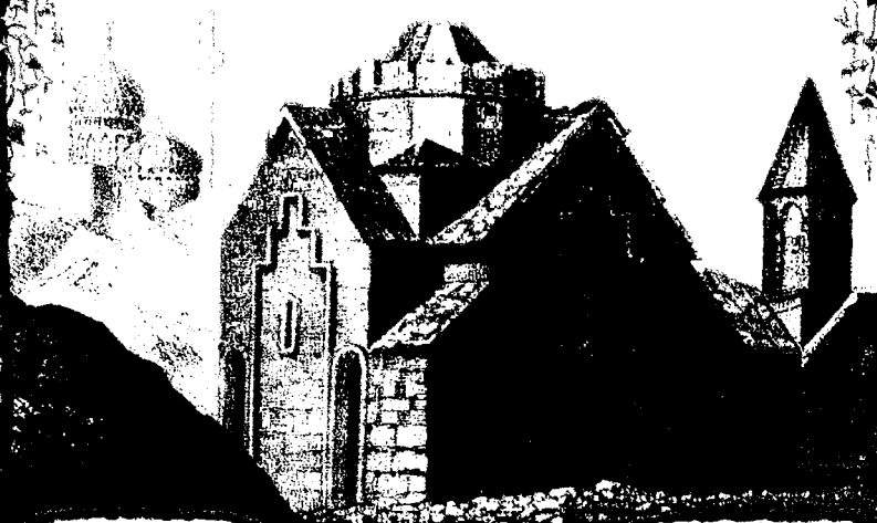
МОНАСТ. ВЪ ДАРАУМЦАГЪ

Изданіе Управленія Кавказскаго Учебнаго Округа.