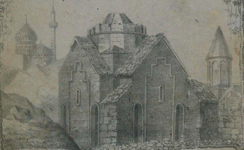
МОНАСТ. ВЪ ДАРАСИЧАГЪ

Изданіе Управленія Кавказскаго Учебнаго Округа.